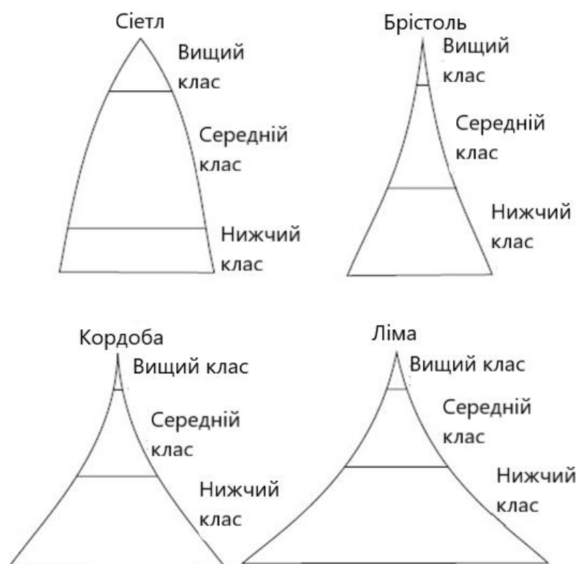
Рис. 3. Розподіл вищого, середнього та нижчого класів у чотирьох містах

Найбільш важливим фактором, що визначає характер і специфіку структури влади в міських спільнотах, є соціальна стратифікація, яка, як зазначалося раніше, визначає порівняльні можливості різних класів та соціальних груп, їх електоральний потенціал, ресурси політичного впливу, систему цінностей, підґрунтя партійно-політичного клівіджа, склад різних організацій спільноти та ін. Розгляд владних відносин у взаємозв'язку з основними соціальними розколами дає можливість Міллеру вписати їх у загальний контекст функціонування суспільно-політичного життя міста, в якому здійснюється складна взаємодія економічних, політико-державних та соціальних факторів із владною структурою.